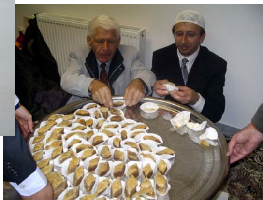
Bajramska baklava by Melina. All rights reserved.