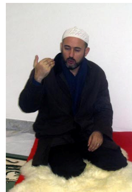
Nekoliko riječi o fikhu