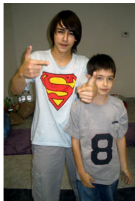
I Supermen posti