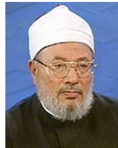
dr. Yusuf el-Qaradawi: Muslimani treba da izraze svoj gnjev